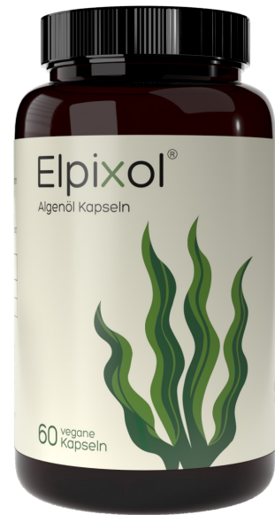
Elpixol Algenöl Kapseln Inhalt: 60 Stk. PZN: 18759530