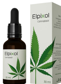
Elpixol Cannabisöl Tropfen 30 ml PZN: 16612544 UVP: 39,99 €