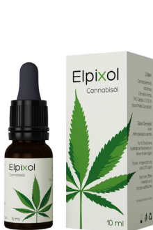
Elpixol Cannabisöl Tropfen 10 ml PZN: 16612550 UVP: 19,99 €