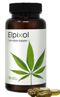
Elpixol Cannabisöl Kapseln 60 St. PZN: 17902764 UVP: 29,95 €