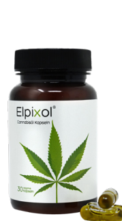
Elpixol Cannabisöl Kapseln 30 St. PZN: 18319133 UVP: 17,95 €