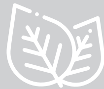
Sekundäre Pflanzenstoffe (Superfoods)