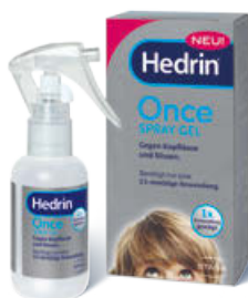
Hedrin® Once Spray Gel, 60 ml Ausreichend für 2 Anwendungen