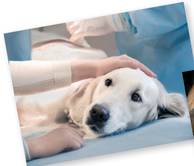
Vor und nach OP's