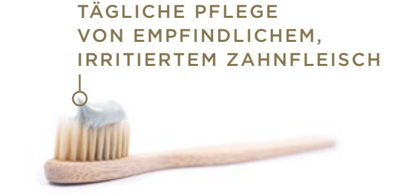
TÄGLICHE PFLEGE VON EMPFINDLICHEM, IRRITIERTEM ZAHNFLEISCH