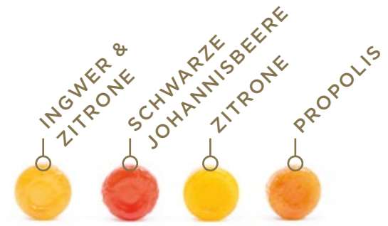
INGWER & ZITRONE SCHWARZE JOHANNISBEERE ZITRONE PROPOLIS