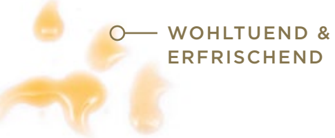
WOHLTUEND & ERFRISCHEND