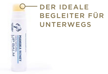
DER IDEALE BEGLEITER FÜR UNTERWEGS