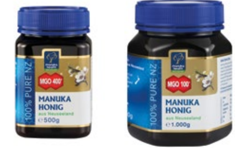
MGO 400+ (500 g) MGO 100+ (1 kg)