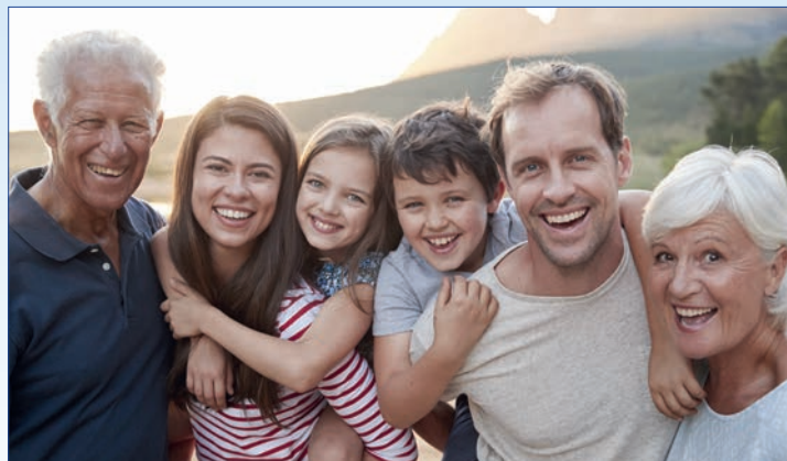
Das stärkt die Resilienz: Freunde und Familie, auf die man sich verlassen kann.

Studien zeigen, dass Stressresilienz zum Teil genetisch bedingt ist. Aber auch das soziale Umfeld und die dadurch erfahrene Unterstützung spielen eine große Rolle beim Umgang mit Stress: Ein unterstützendes Netzwerk aus Nachbarn, Kollegen, Freunden und Familie sowie Optimismus und Zuversicht stärken beispielsweise diese Widerstandskraft.