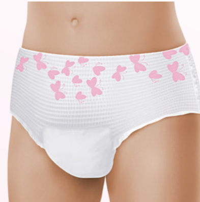
Tragekomfort wie Unterwäsche