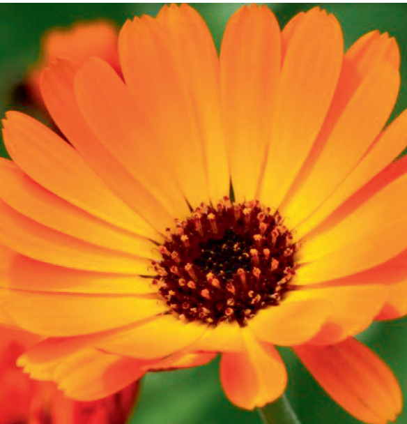
Calendula – Ringelblume

der Herstellung und der nichtindividuellen Anwendung. Zur Phytotherapie gehören u. a. pflanzliche Extrakte für Tees und Umschläge, Präparate zum Einnehmen oder äußerlich anzuwendende Salben zum Beispiel mit Arnika, Kamille, Ringelblume oder Propolis. Gerade für Neurodermitiker aber gilt: Vorsicht – einige Pflanzen bzw. Pflanzenprodukte, insbesondere Arnika und Propolis, lösen häufig Allergien aus!