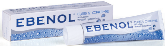
Ebenol® 0,25 % Creme geeignet für trockene Haut