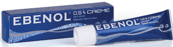
Ebenol® 0,5 % Creme geeignet für trockene Haut