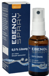
Ebenol® Spray 0,5 % Lösung nicht fettend