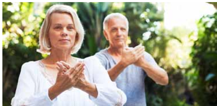
Mit langsamen, fließenden Bewegungsabläufen wirken sich Tai Chi, Qi Gong und Yoga positiv auf Körper und Seele aus.

Yoga ist eine uralte indische Lehre der Einheit von Körper, Geist und Seele. Viele hiesige Kursangebote sind ganz auf unsere westlichen Bedürfnisse zugeschnitten. Neben Entspannung und mehr Beweglichkeit bietet Yoga Hilfe bei vielen Gesundheitsstörungen. Dabei legen einige meditative Formen ihren Schwerpunkt auf die geistige Konzentration, andere mehr auf körperliche Übungen sowie Atemtechniken. Yoga lernen Sie am besten in einer kleinen Gruppe unter fachkundiger Anleitung.