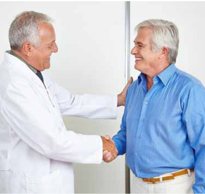
Ein Arzt kann feststellen, ob Ihr Testosteronspiegel zu niedrig ist.

Männer gehen in der Regel nur ungern zum Arzt, wenn sie nicht ernsthaft krank sind. Dennoch sollten Sie Wechseljahresbeschwerden nicht als „Befindlichkeitsstörungen“ abtun, sondern fachliche Hilfe suchen. Zum einen können viele der genannten Symptome auch andere Ursachen haben, die abgeklärt werden sollten. Und zum anderen kann Ihr Arzt mithilfe einer Blutuntersuchung feststellen, ob Ihr Testosteronspiegel tatsächlich zu niedrig ist. Ansprechpartner ist in der Regel Ihr Hausarzt, alternativ können Sie sich auch an einen speziellen Männerarzt (Andrologen) wenden.