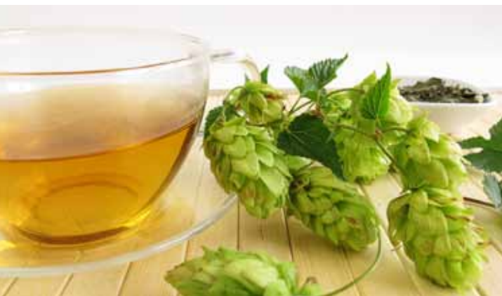
Hopfentee hilft gegen Schlafstörungen in den Wechseljahren.

Gegen Schlafstörungen in den Wechseljahren helfen Präparate mit Hopfen und Baldrian: Sie beruhigen sanft, lindern Nervosität und schaffen so die Voraussetzungen für einen erholsamen Schlaf. Außerdem wirken sie depressiven Stimmungen entgegen.